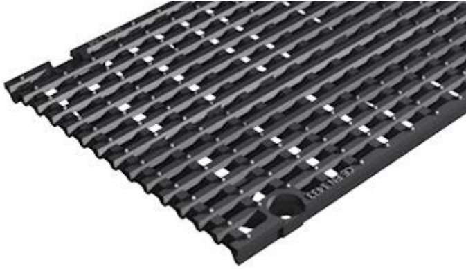
Ruszt żeliwny prętowy E 600 kN